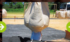
客土工: 芝生基盤材/床土(ゆいサンド)