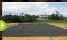
床土敷き均し完成