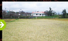
完成(名護市立久辺小学校)