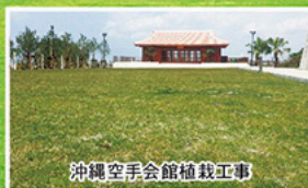
沖縄空手会館植栽工事